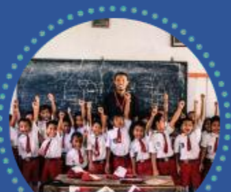
MENGAJAR DISATUAN PENDIDIKAN