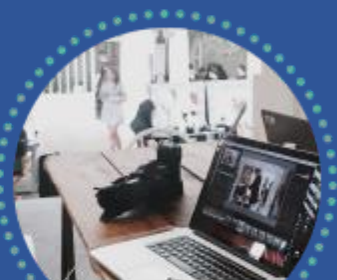
MAGANG/ PRAKTIK INDUSTRI